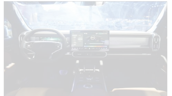
مقصورة مزودة بأحدث التقنيات