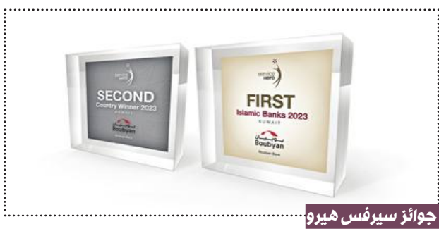
جوائز سيرفس هيرو

وبهذه المناسبة، قال التويجري: «تأتي جائزة سيرفس هيرو هذا العام لتعكس التزامنا باتباع أفضل المعايير الدولية في خدمة العملاء وتؤكد ثقتنا في مستوى ما نقدمه من خدمات وحلول داعمة لتطلعات عملائنا ومواكبة لاحتياجاتهم، الأمر الذي يؤكد قوة المركز الريادي لبوبيان وإسهاماته الاستثنائية والمميزة في هذا المجال بين مؤسسات القطاع المالي الكويتي. وأوضح أن علاقة بوبيان مع عملائه تشكل استناداً لقدرته على مواجهة التحديات مما عزز قدرة البنك على مواكبة