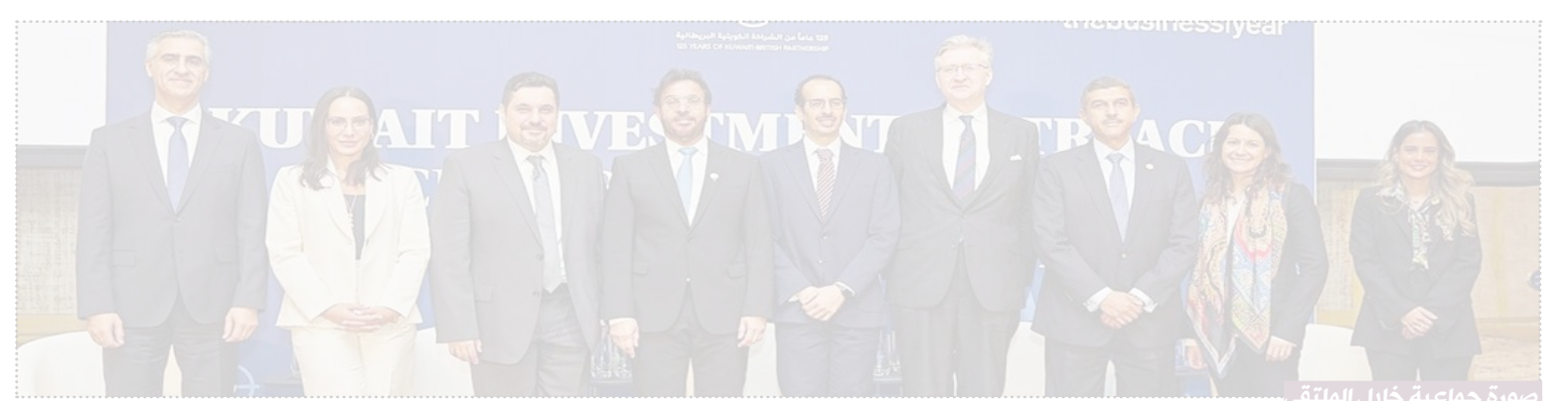
صورة جماعية خلال الملتقى

وأشاد الدعيج بالتطور الهائل للمملكة المتحدة في مجالات التكنولوجيا والمدفوعات والابتكار، ودعا إلى استمرار التعاون بين المملكة المتحدة والكويت في هذه المجالات لمواصلة تطوير حلول الدفع الرقمية، وتكنولوجيا الأمن السيبراني، والمنتجات المتوافقة مع الشريعة الإسلامية.