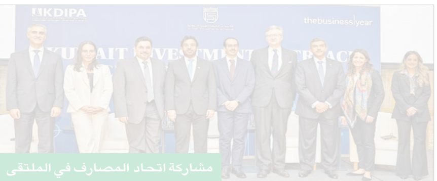
مشاركة اتحاد المصارف في الملتقى

وافتتح المؤتمر من الجانب الكويتي وزير المالية وزير الشؤون الاقتصادية والاستثمار د. أنور المشف، بحضور سفير الكويت لدى المملكة المتحدة بدر العوضي، وسفيرة المملكة المتحدة بالكويت بيليندا لويس، ورئيس مجلس إدارة اتحاد مصارف الكويت رئيس مجلس إدارة البنك التجاري