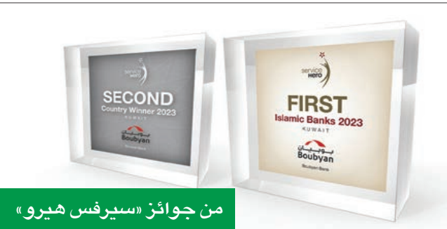
من جوائز «سيرفس هيرو»

وفقاً لمؤشر «سيرفس هيرو لرضا العملاء» للعام الـ 14 على التوالي